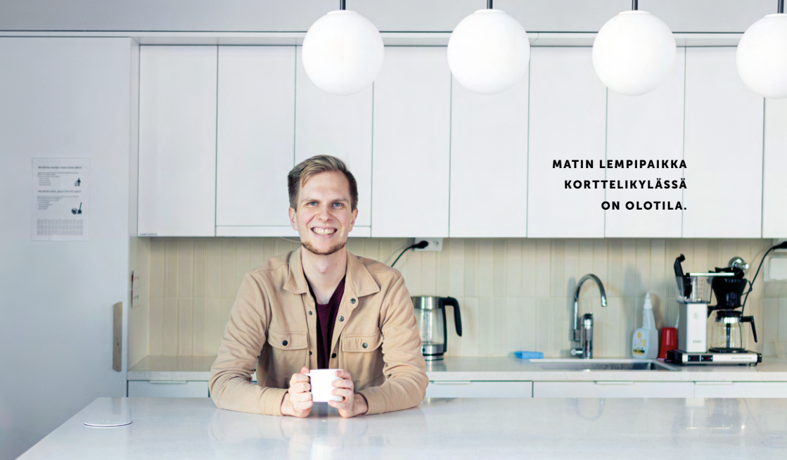
MATTIN LEMPIPAIKKA KORTTELIKYLÄSSÄ ON OLOTILA.

kavereiden asunnoissa. Olotilassa on väljempää ja siellä on kiva hengaila kavereiden ja muidenkin asukkaiden kanssa esimerkiksi lautapelejä pelaten. Viime itsenäisyyspäivänä katsoimme täällä Linnan juhlat ja söimme juhlaillallista.”