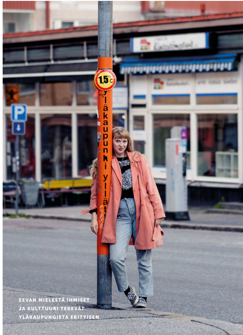
EEVAN MIELESTÄ IHMISET JA KULTTUURI TEKEVÄT YLÄKAUPUNGISTA ERITYISEN.